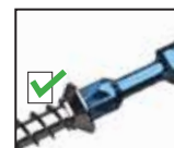
Embout Blue Shock

La zone de flexion est renforcée de chaque côté pour un lien plus fort dans la zone de torsion.