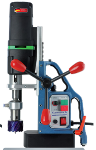
Base pivotante 360°